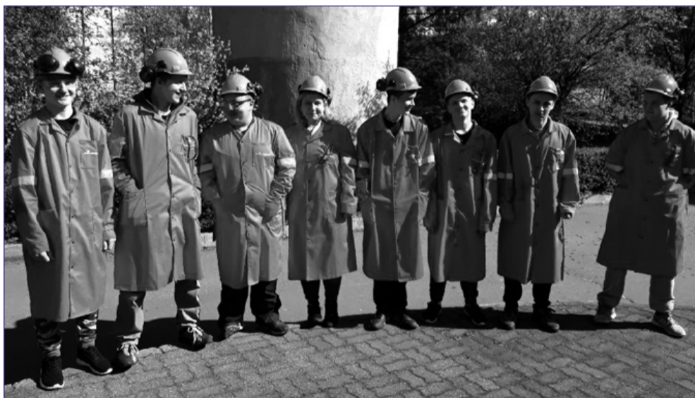
...a w czwartek w Hucie gościła młodzież z Centrum Kształcenia Zawodowego i Ustawicznego.

dziły dwie grupy młodzieży ze szkół ponadgimnazjalnych. W poniedziałek byli to uczniowie Technicznych