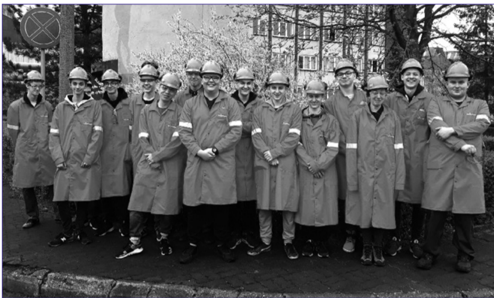
Walcownię Blach Grubych w poniedziałek zwiedzili uczniowie Technicznych Zakładów Naukowych...

W tym tygodniu Walcowni Blach Grubych odwie-